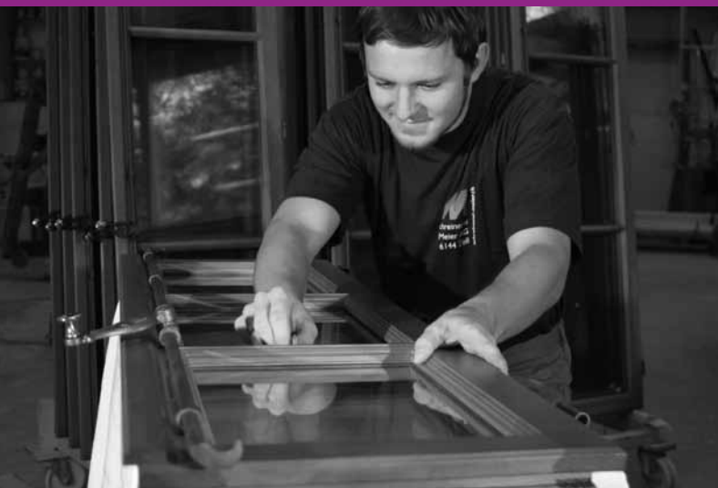
Fertigung eines historischen Fensters.