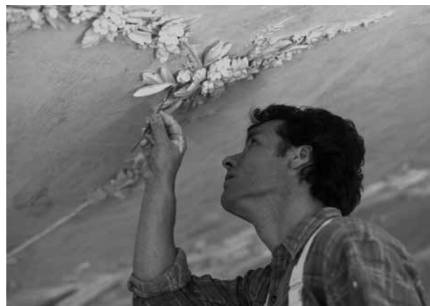
Ein Ornament wird modelliert.

Sie pflegen eine enge Zusammenarbeit mit Fachleuten aus Denkmalpflege, Architektur, Konservierung und Restaurierung sowie anderen handwerklichen Berufen. Zudem sind sie mit ihrem fachlichen Wissen auch Botschafterinnen und Botschafter für traditionelle Handwerkstechniken sowie eine lebendige Schweizer Kulturlandschaft.