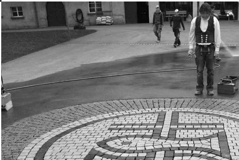
Pflasterung als Verzierung vor dem Kloster Fischingen.

Das Werkzeug und die Methoden der Pflastererinnen und Pflasterer haben sich in den vergangenen Jahrhunderten kaum verändert. Trotzdem verlangt die Arbeit an historischen Stätten von diesen Berufsleuten besondere Kenntnisse. Sie analysieren Pflasterungen auf Strassen, öffentlichen Plätzen oder in Innenhöfen und wählen anschliessend Materialien und Verlegearten, die dem Charakter der alten Steine sowie der Umgebung entsprechen. Oft müssen dabei in aufwändiger Handarbeit nur einzelne Steine oder Segmente herausgelöst und ersetzt werden.