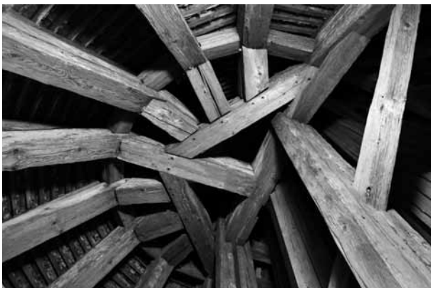
Dachstuhl der Jesuitenkirche in Luzern.