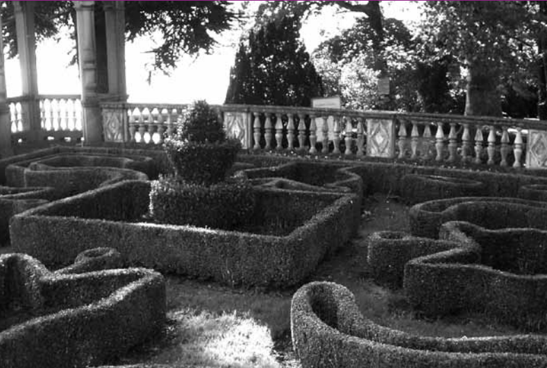
Gartenanlage beim Schloss Meggenhorn.