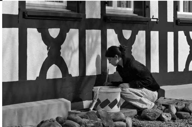
Fachwerksanierung an einem ehemaligen Bauernhaus in Hettlingen.

Im Gewerbe der Malerei sind die traditionellen Werkstoffe wie Kalkfarbe, Kalkkaseinfarbe und Leimfarbe sowie historisch relevante Bearbeitungsweisen durch industriell gefertigte, einfach zu verarbeitende Produkte in den Hintergrund gedrängt worden. Diese Materialien und Techniken sollen Malerinnen und Maler, die im historischen Bestand arbeiten, wieder einsetzen können und dabei relevante Faktoren wie die Bauphysik sowie die Materialisierung des Untergrunds berücksichtigen.